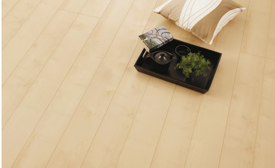
木目タイプ(151) ジェラータ

足もとから、エコロジーな暮らしを 人にも、地球にもやさしい「エコハード12」誕生