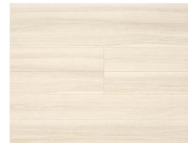
Italian Walnut イタリアンウォルナット