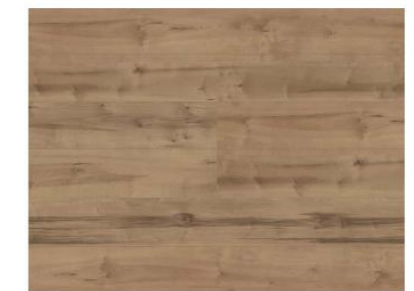
Light Maple ライトメープル