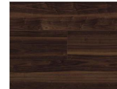
Black Walnut ブラックウォルナット